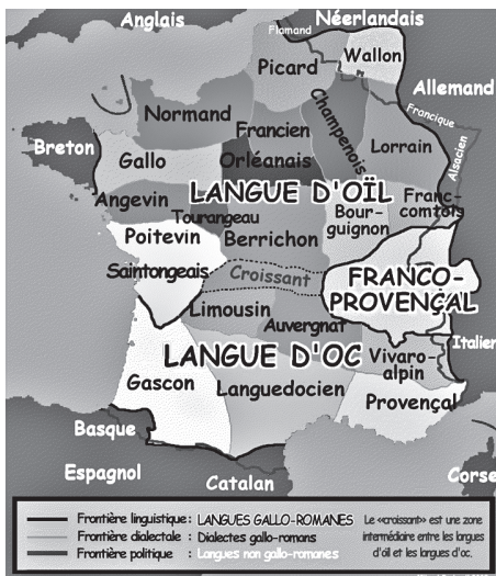
La France dialectale

La première catégorie comprend le breton, l'alsacien, le flamand de France; la deuxième catégorie rassemble le basque de France et la troisième regroupe, d'une part, au sein du groupe gallo-roman 2 : le gallo, le normand, le picard, le wallon, le poitevin, le saintongeais, l'angevin, le mayennais, le berrichon, le bourguignon-morvandiau, le champenois, le franc-comtois, le lorrain et, d'autre part, au sein du groupe occitano-roman : l'occitan, le catalan de France, le franco-provençal, le corse, le nissart, le ligure monégasque (parlé sur le territoire de la cité-État de Monaco), le limousin, l'auvergnat, le languedocien, le gascon, le béarnais.