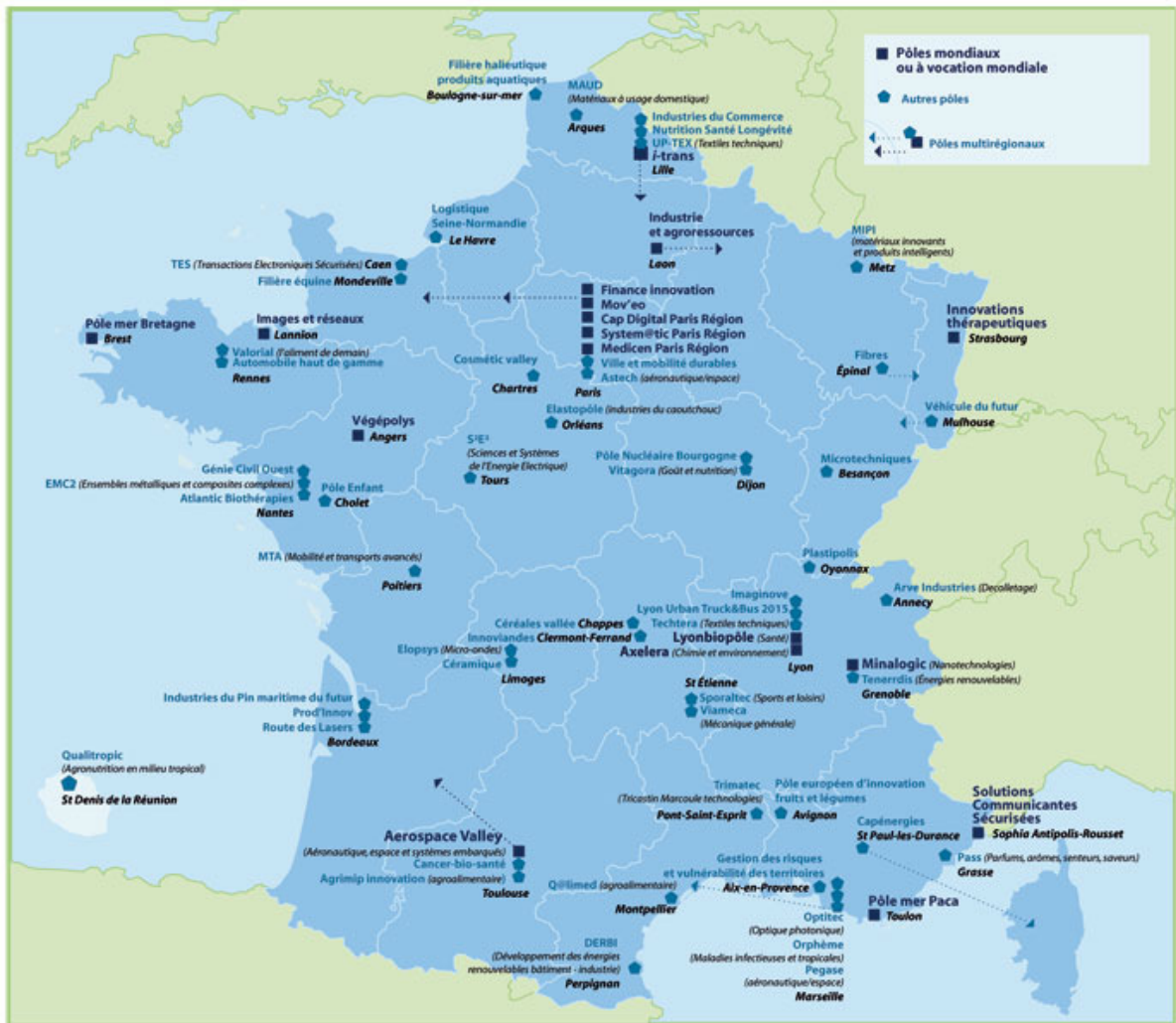
Figure 2 : Cartographie des PC 4

Au niveau de la région Rhône-Alpes (cf. Fig. 2) cela se traduit par 15 pôles de compétitivité dont 3 mondiaux (LyonBiopôle, Minalogic, Axelera) 5 sur les 71 français.